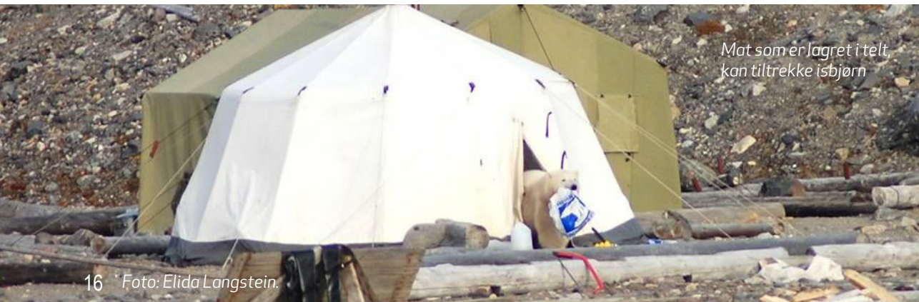
Mat som er lagret i telt, kan tiltrekke isbjørn

Echinococcus multilocularis er en bendelorm som østmark-musa på Svalbard er mellomvert for. Parasittens hovedvert er hund, katt og rev. Mennesker kan få alvorlig leverskade og dø dersom de får i seg parasittens egg. Disse finnes i avføring fra hovedverte.