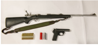
Grovkalibret rifle og signalpistol med ammunisjon.