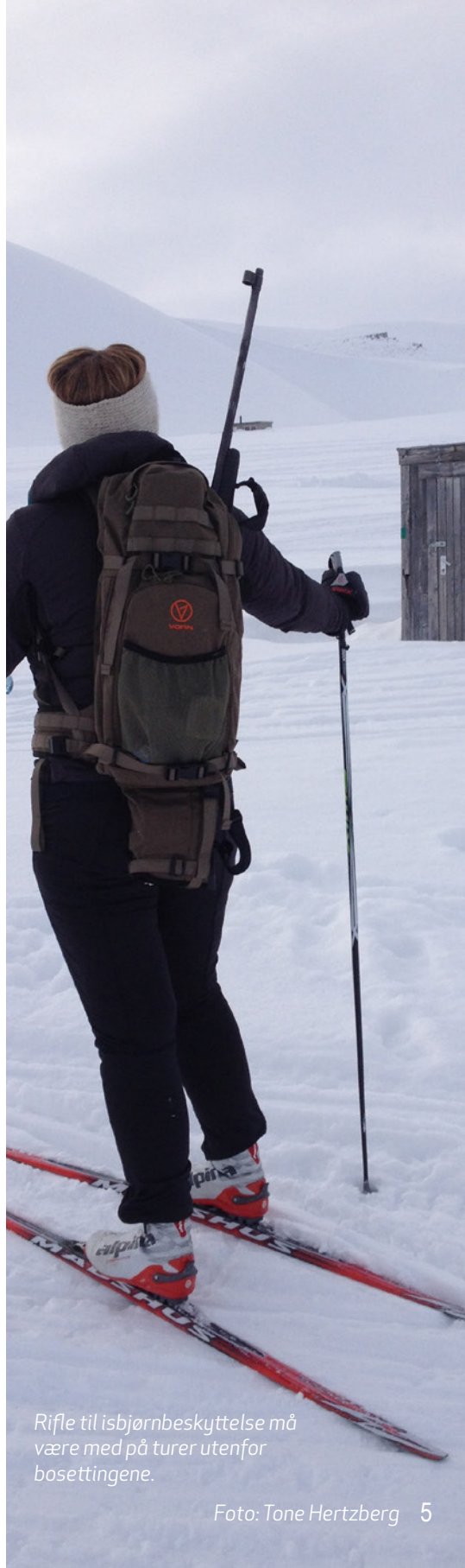
Rifle til isbjørnbeskyttelse må være med på turer utenfor bosettingene.

I tillegg anbefaler vi rifle i kaliber .308 Win eller grovere til isbjørnbeskyttelse.