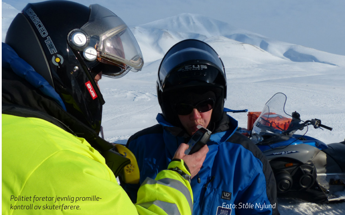
Politiet foretar jevnlig promillekontroll av skuterførere.