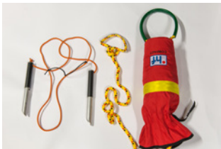
Ispigger og kasteline.