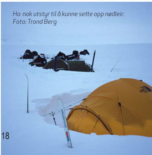
Ha nok utstyr til å kunne sette opp nødleir.

Sørg for at turlaget kan førstehjelp og har med tilstrekkelig førstehjelpsutstyr. Det kan ta lang tid før hjelp kommer fram, for vanskelige vær- og føreforhold kan forsinke hjelpen kraftig. Riktig nødutrustning og din kunnskap og erfaring i førstehjelp kan være avgjørende for deg og dine turkamerater. Nøl ikke med å grave deg inn i snøen eller sette opp nødleir.