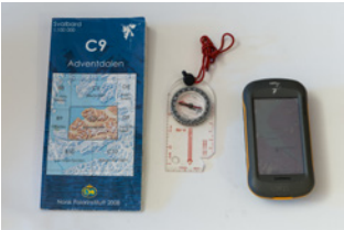
Kart, kompass og GPS.