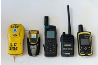
To typer nødpeile-sendere, satellit-telefon, VHF-radio og InReach.