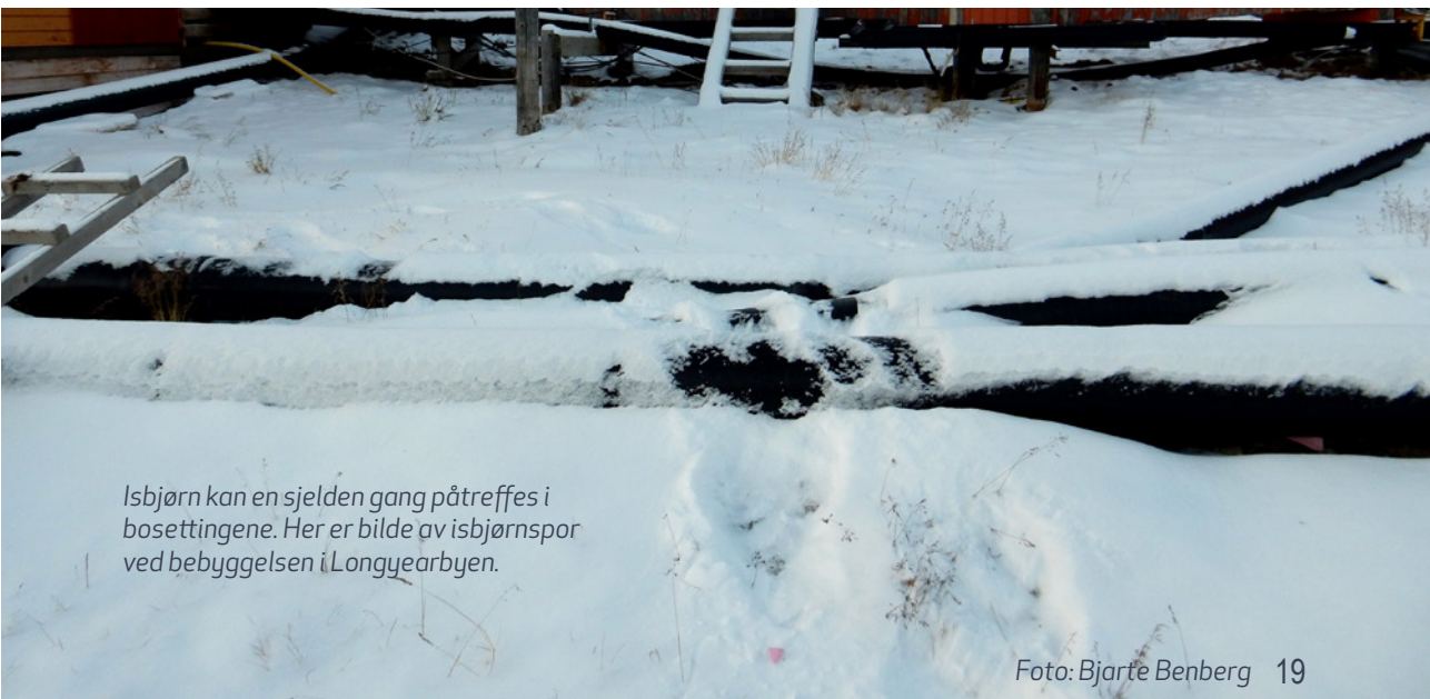
Isbjørn kan en sjelden gang påtreffes i bosettingene. Her er bilde av isbjørnspor ved bebyggelsen i Longyearbyen.

Vi ønsker deg et hyggelig og trygt opphold.